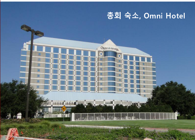
총회 숙소, Omni Hotel